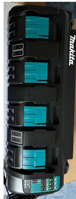
Makita 4-es akksi töltő