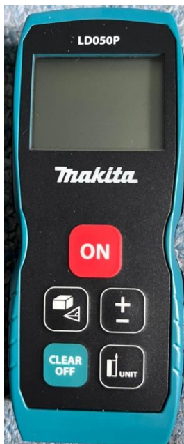
Makita lézeres távolságmérő

Projektazonosító: 3281282455_ „Kivitelezői tevékenység indítása”