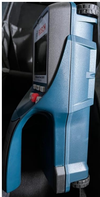
Bosch D-Tect keresőműszer